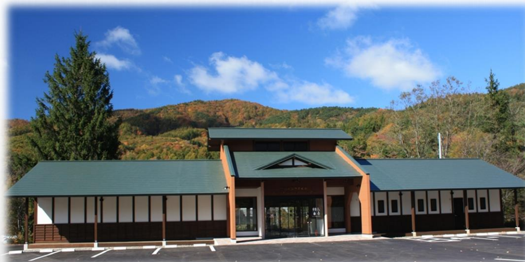
橋野鉄鉱山インフォメーションセンター