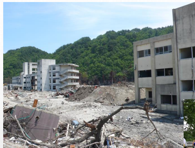
被災後の東中と(左)、鵜住居小