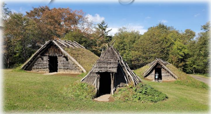
北海道・北東北の縄文遺跡群(御所野遺跡)