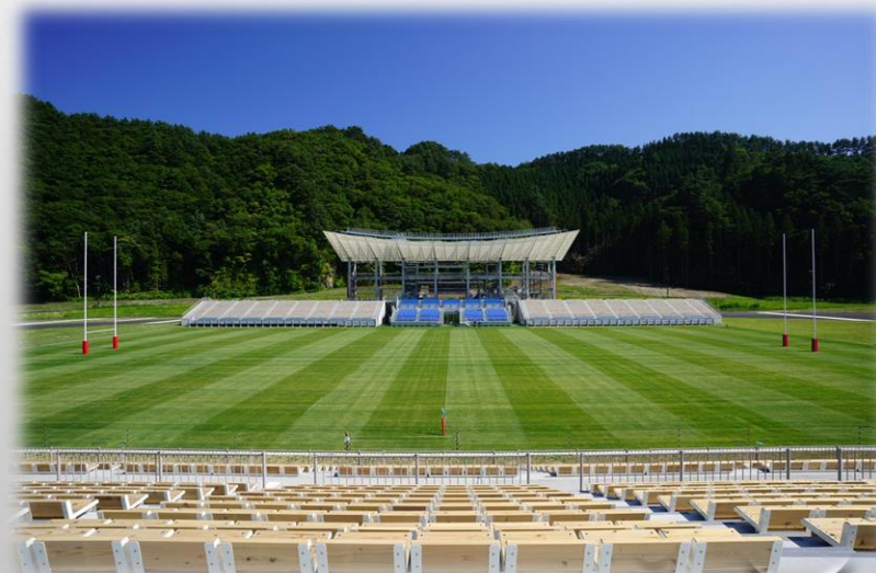
釜石鵜住居復興スタジアム