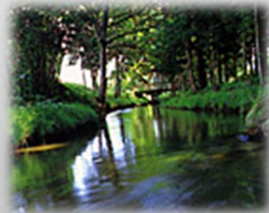
日本のふるさと遠野(カッパ淵)