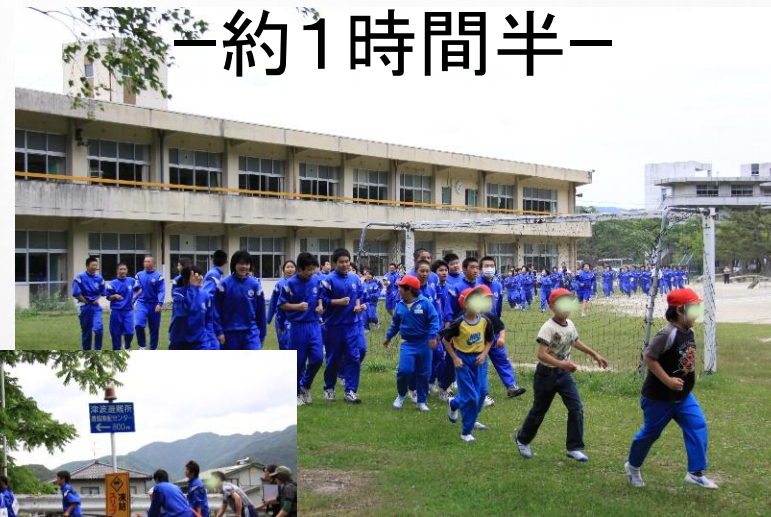
東中と鵜住居小の避難訓練(震災前)