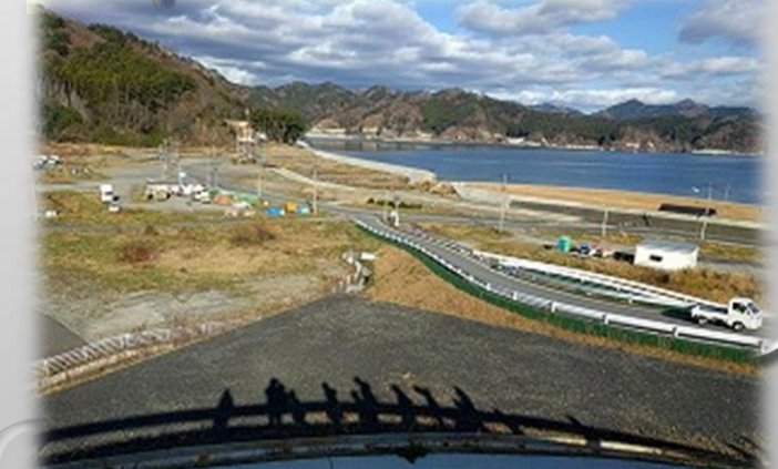
移転した根浜集落から海を望む