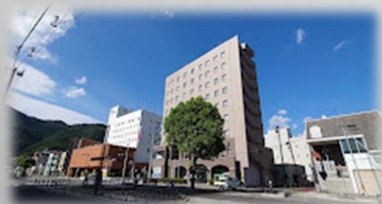
釜石ベイシティホテル