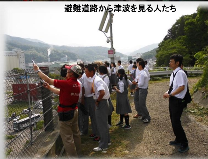
避難道路でのガイド