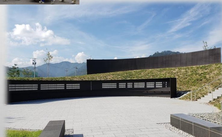
釜石祈りのパーク