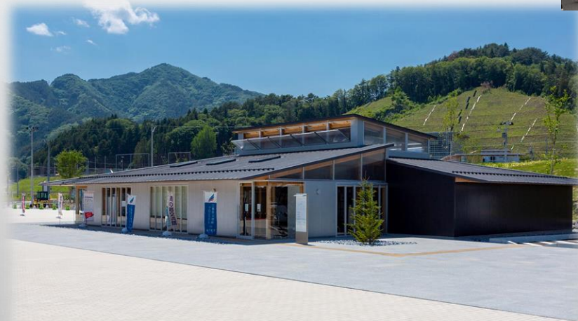
いのちをつなぐ未来館