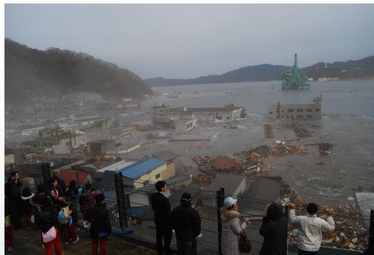
避難道路から津波を見る人たち