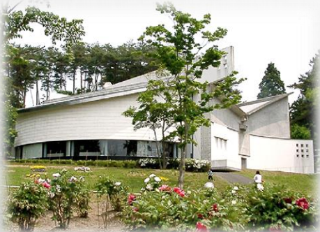
宮澤賢治イーハトーブ館