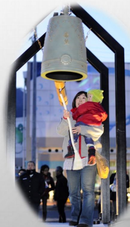
復興の鐘(釜石駅前)